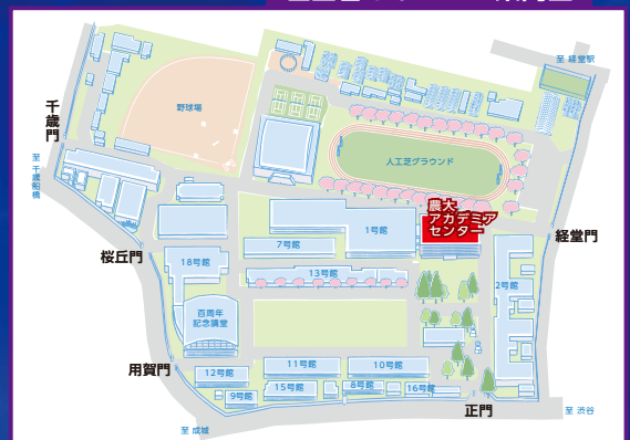
世田谷キャンパス案内図

東京農業大学生物資源ゲノム解析センター(事務局) 所在地：東京農業大学世田谷キャンパス 12 号館 6 階 E-mail : kyoten-g@nodai.ac.jp Tel : 03-5477-2769